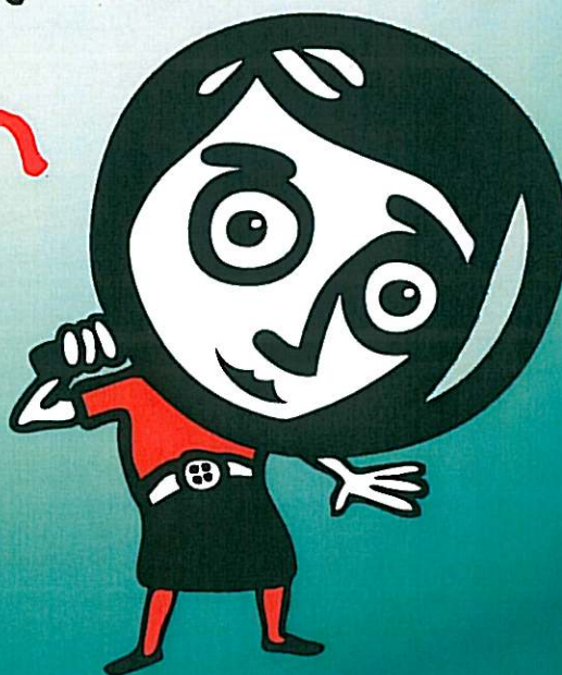
ILLUSTRATION : STUDIO TRICOT

2012, année des salariés des TPE*. En décembre 2012, 4 millions de salariés de l'artisanat, du commerce, des services, des professions libérales, de l'industrie ont leur élection.